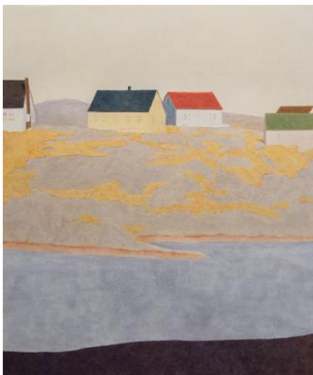
Guim Tio, <The other side>, 2024, oil on canvas, 162x130cm