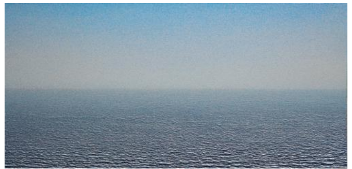
Oh Byungwook, <Sea of My Mind #2605016>, 2026, acrylic on canvas, 80x160cm

Focusing particularly on the theme of "The Sea Within the Viewer's Mind," Oh conveys the sublimity and tranquility of nature through the interplay and reactions of light and materials. The shimmering particles of paint and his signature arched canvases expand the landscape, summoning an "inner sea" that leads the viewer into an emotional scenery that is at once both unfamiliar and deeply familiar.