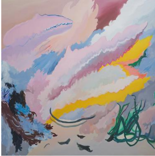
Choi Suin, <Vanishing Body>, 2026, Oil on canvas, 130.3x130.3cm