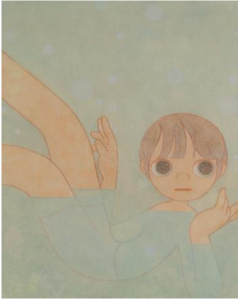
Kang Junseok, <Floating on Still Waters>, 2026, acrylic on canvas, 90x73cm