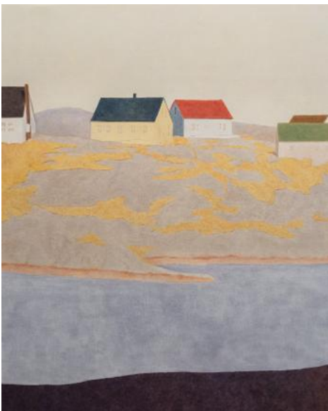
Guim Tio, <The other side>, 2024, oil on canvas, 162x130cm

기욤 티오는 바르셀로나에서 태어나 바르셀로나대학교 회화과를 졸업한 작가로, 인간 존재와 풍경을 주제로 한 회화 실험으로 주목받아왔다. 그는 오랫동안 유머와 아이러니를 담아 '인간 조건'을 탐구하며, 최근에는 산과 바다, 들판, 눈밭 등 광활한 자연을 배경으로 작은 인물들을 배치하는 풍경 시리즈를 선보이고 있다. 자연에 덮인 과감하면서도 차분한 색의 사용은 단순한 풍경 재현을 넘어, 관람자로 하여금 작가 내면에서 비롯된 '미지의 자연'으로 몰입하게 한다. 그의 회화는 개인적 기억과 경험을 바탕으로 하며, 익숙하면서도 잊고 있던 감정의 본질을 환기시킨다. 스페인과 한국은 물론 대만, 중국, 미국, 프랑스, 이탈리아 등 전 세계를 무대로 활발하게 활동하고 있다.